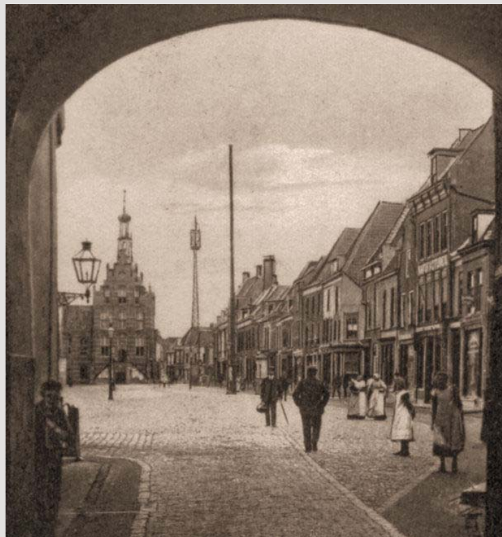
Blik op het Marktplein in 1923