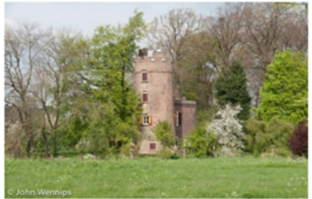
Restant kasteel Schonauwen.

De overgebleven ronde bakstenen toren staat op een eiland dat geheel door een gracht is omgeven en heeft een doorsnede van 5,5 meter en een hoogte van 13,5 meter. Het is gelegen ten zuiden van het dorp Houten, tussen de huidige Schalkwijkseweg en het Amsterdam-Rijnkanaal, in de nieuwbouwwijk “De Steen”.