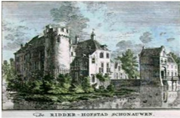
Afb. Door Hendrik Spilman (ca. 1750)

Gelet op de hoge ouderdom en het belang van het kasteel als steunpunt van de heren Van Culemborg, mogen we aannemen dat Schonauwen een aantal bouwfasen heeft gekend.