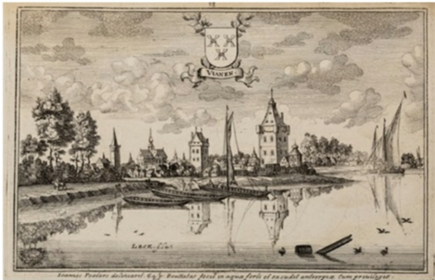
Kasteel Batestein , in volle glorie afgebeeld op het schilderij van Vroom

In 1277 ontving Zweder van het kapittel van Oudmunster ook nog de plaats Lexmond in erfpacht.